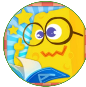
Pintar Kata 1.0